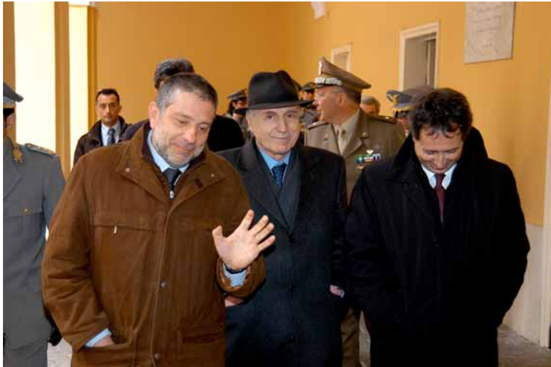
I relatori del convegno e le autorità al termine della giornata dei lavori e della visita al Centro